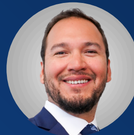
Daniel Palomino Estudio Muñiz